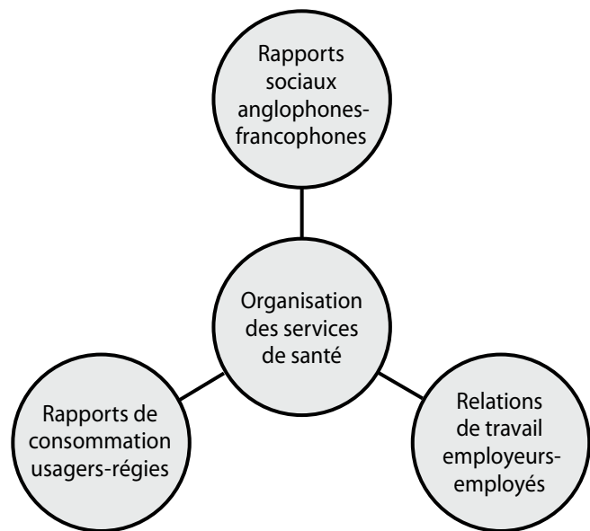
Les figures de la page suivante schématisent les facteurs influençant l'offre de services en français.

Comme l'illustre le schéma suivant, l'organisation des services de santé est déterminée par trois types de rapports sociaux : les rapports entre les anglophones et les francophones, les relations de travail entre employeurs et employés et les rapports de consommation entre les usagers et les régies prestataires des services.